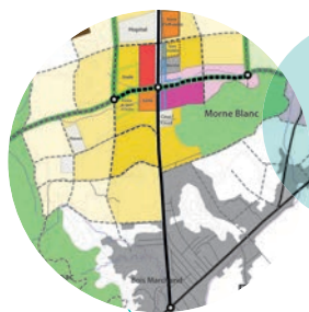
Schéma d'Aménagement du quartier du Morne Blanc aux Gonaïves AFD - Haïti - (2012)

Schéma d'Aménagement du Pole de Développement Intégré de Tenke et Fungurume - TFM sarl - RD Congo - (2013)